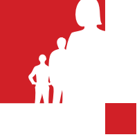
Prilog 1. Algoritam zdravstvenog nadzora nad kontaktima oboljele osobe i hrvatskim građanima i strancima koji ulaze i ostaju u Hrvatskoj, a unazad 14 dana su boravili u zahvaćenom području